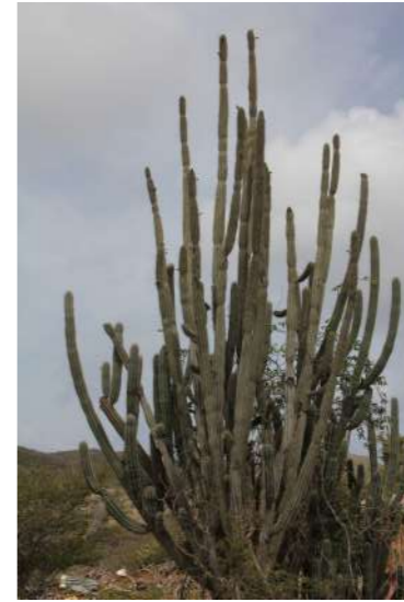
Kadushi Cereus repandus