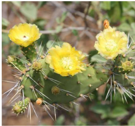
Infrou (Tuna) Opuntia caracasana