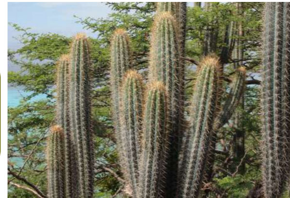
Kadushi di pushi Pilosocereus lanuginosus

Zijn de bloemen geel? ja → Infrou (Tuna) Opuntia caracasana nee → Kruiwend en klein?