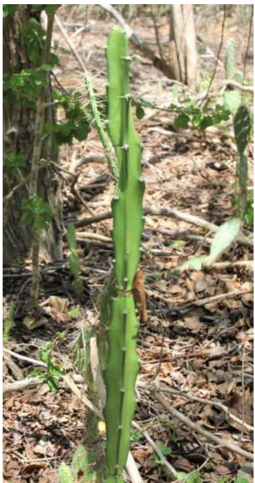
Kadushi di kolebra Acanthocereus tetragonus

heeft de cactus witte haartje bovenop? ja → Kadushi di pushi Pilosocereus lanuginosus nee → Is de Stengel 3 (4 of 5) kantig?