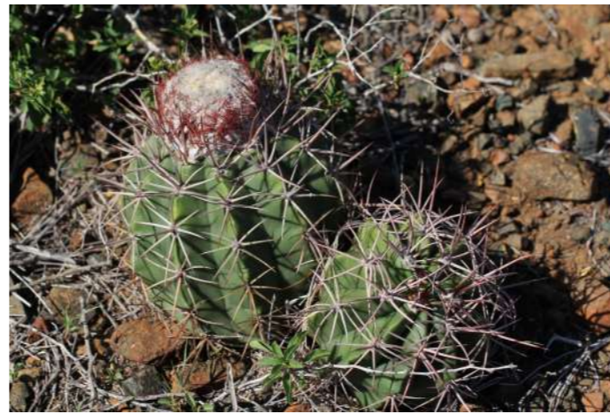
Milon di seru Melocactus macrocanthos