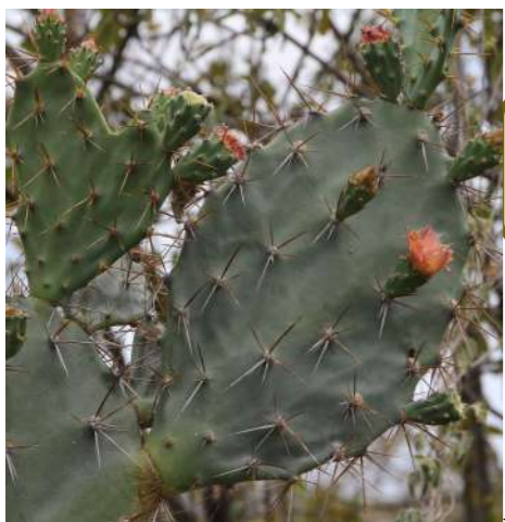
Tuna (Tuna di baka) Opuntia elatior

Staan de stekels op kleine bolletjes? ja → Bushito Mammillaria mammillaris nee → heeft het wit/ gele stekels?