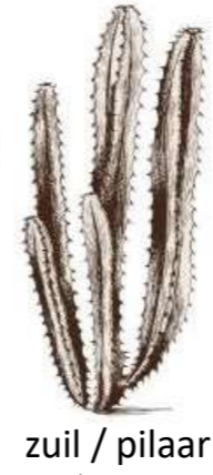
zuil / pilaar

heeft de cactus ribben? ja → Milon di seru Melocactus macrocanthos nee → heeft het gele stekels?