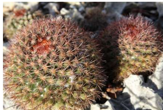
Bushito Mammillaria mammillaris