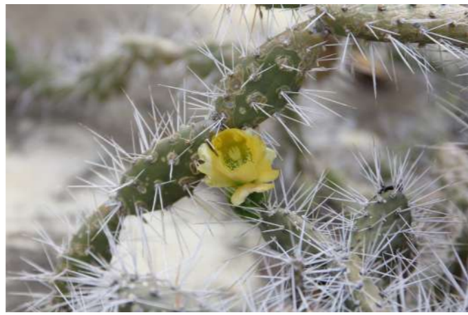
Kaka di pushi Opuntia curassavica